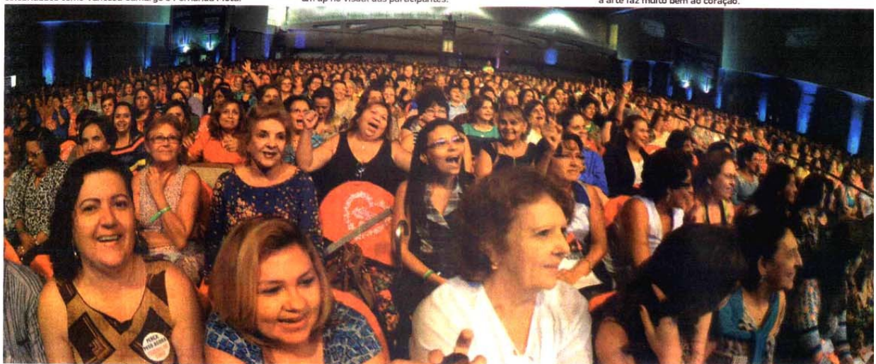
A emoção tomou conta das mais de 12 mil mulheres participantes que realmente deram um grande show nesse Encontro.