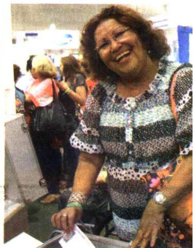
Durante o Encontro de Mulheres, as participantes puderam concorrer a uma série de prêmios, entre eles, um carro 0 km.