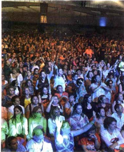
A 10ª edição do Encontro de Mulheres bateu recordes de público. Foram mais de 12 mil participantes que se emocionaram nesses quatro dias de espetáculo.