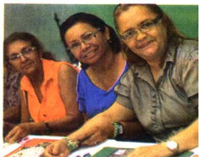
Nas Oficinas de Scrapbook rolou muita diversão e super dicas. As participantes montaram seus próprios projetos e perceberam que a arte faz muito bem ao coração.