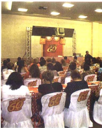
Nas Oficinas Culinárias do Encontro, as participantes aprenderam e se divertiram descobrindo um mundo de novos sabores.