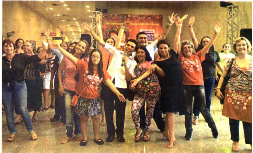
Dançar faz bem para o corpo e para a alma. Nas Oficinas de Dança as participantes aprenderam vários ritmos e se divertiram muito.