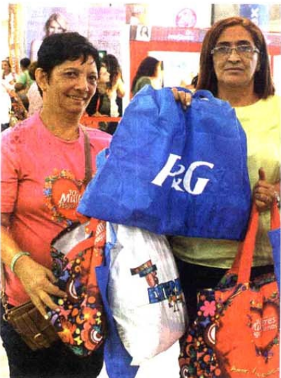
Na Megafeira de Saúde e Beleza, as participantes conferiram novidades em mais de 150 estandes, além de ações especiais com celebridades como Vanessa Camargo e Fernanda Mota.

Aprendizado, lembranças, emoção. Nesses quatro dias, a Pague Menos provou que o amor realmente faz um grande espetáculo. Acompanhe alguns momentos do 10º Encontro de Mulheres Pague Menos e sinta um pouco dessa emoção.