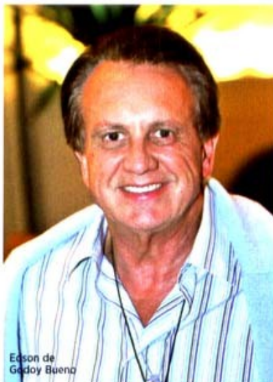
Edson de Godoy Bueno

Cofundador do Facebook, Eduardo Saverin renunciou à cidadania norte-americana em 2011 – notícia que eclodiu dias antes da aguardada abertura de capital da empresa e gerou acusações de evasão fiscal. Sua resposta: “Minha decisão de expatriado foi baseada unicamente em meu interesse em trabalhar e viver em Cingapura, onde estou desde 2009”. Da participação de 5% nas ações do Facebook que conquistou na Justiça, o paulista, ex-colega de Mark Zuckerberg em Harvard, já vendeu mais da metade e começou a investir em startups, como Qwiki e Jumio.